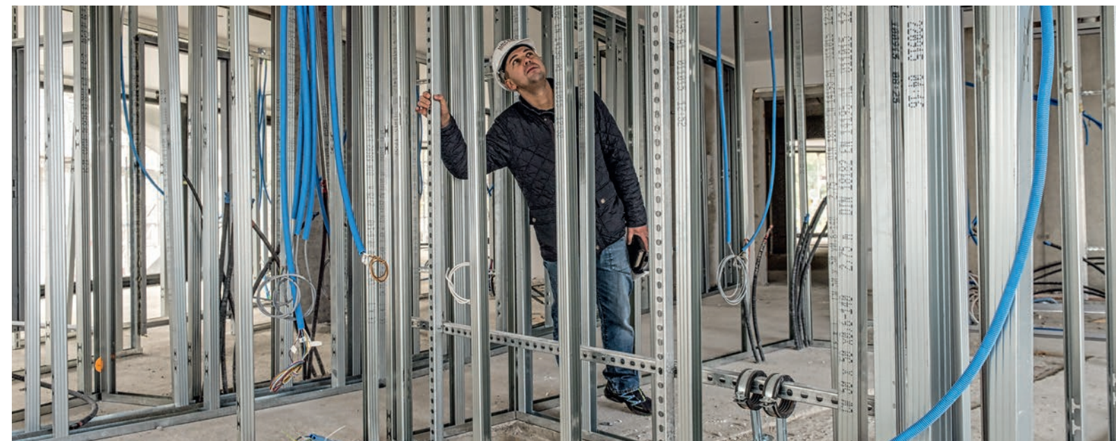
Steigzone mit Montage-Gerüst

«Aber die Projektaufgaben auf dieser Baustelle haben schon viel früher begonnen: Die Montage der Sanitärversorgung im Kellergeschoss ist bereits vor mehreren Monaten erfolgt. Urfer-Müpro hat auch bei diesem Auftrag speditiv mitgearbeitet und die komplette Lieferung professionell abgewickelt.