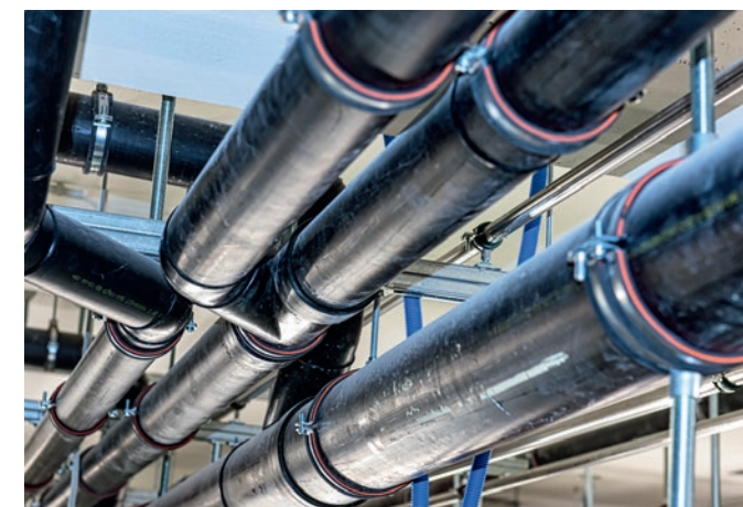
Blick in die Verteilung im Untergeschoss

«Adis Basic hat die Masse aufgenommen, die entsprechenden Schienen zuschneiden und je Steigzone einzeln verpackt anliefern lassen, so dass für uns nur noch das Montieren übrig blieb. Ein schöner Zusatzauftrag für Urfer-Müpro und für uns eine einfache aber sehr effiziente Lösung.