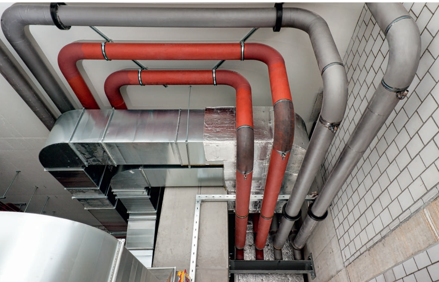
Detailansicht des H-Trägers – einer Spezialanfertigung von Urfer-Müpro – mit darauf abgestellten Vertikalrohren.

Die Bauwerke umfassen je elf Stockwerke, wovon allein zwei im Boden und das Dachgeschoss für die technischen Installationen genutzt werden. Die eindrucksvolle Hauptzentrale für Heizung und Kühlung liegt im 2. UG. Von hier aus steigen die Versorgungsrohre zum Teil bis 36 m hoch aufs Dach zu den technischen Anlagen (Heiz-/Klima-Aggregate). Die Hauptleitung für die Rückkühlung hat einen Durchmesser von 273 mm, daraus resultiert ein enormes Gewicht.