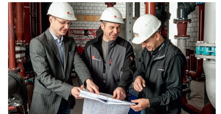
Vor-Ort Besprechung und Projektkontrolle mit dem Kunden.

Die Anlieferung des in der eigenen Werkstätte gefertigten H-Trägers mit verschweissten Verankerungsplatten und dämpfenden Gummimatten erfolgte bereits wenige Tage nach der Bestellung. Aber auch die Aufhängungen und Befestigungen der übrigen Versorgungsleitungen stammen in diesem grossen Gebäude aus der «XXL»-Abteilung und sind nicht einfach Lagerware. Durch eine minutiöse Planung und Organisation wurden die verschiedenen Losgrößen «Just-in-time» vormontiert, auf die Baustelle geliefert und konnten so zeitnah eingebaut werden.