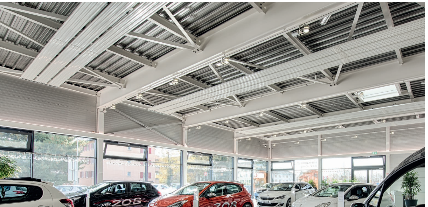
Deckenstrahlplatten-Heizung in luftiger Höhe.

In Zusammenarbeit mit dem verantwortlichen Sanitär- und Heizungsunternehmen, der Firma Schneitter AG aus Langendorf, liefert Urfer-Müpro die Befestigungstechnik für die Heizungs- und Sanitärinstallationen.