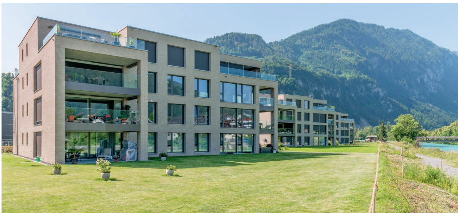
Attraktive Wohnlage am Wasser.

2016 erfolgte der Start – und Stand heute, dauern die Bauarbeiten noch bis ca. 2025. In drei Etappen entstehen 171 Wohnungen, die Mehrzahl im Stockwerkeigentum. Die kubischen Baukörper mit drei- und vier- Obergeschossen sind im Untergrund mit einer durchgehenden Parkhalle, mit Keller- und Versorgungsräumen verbunden. Verschiedene Einheiten sind bereits bezogen, andere aus der zweiten Etappe sind am Entstehen und die dritte Etappe steht erst am Start. An diesem schwül-heissen Sommertag begrüßen wir die Installations-Profis der Hauenstein AG aus Steffisburg auf der Schalung zur zweiten Betondecke. Über die Distanzhalter werden hier Unter- und Ober-Armierung gerichtet, sodass die Eisen perfekt ausgelegt werden können.